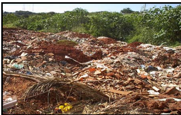
Figura 2 – Vista do local de lançamento de entulho em Ilha Solteira.

Outro fato importante, diz respeito a simples disposição dos resíduos em aterros sanitários, que vêm se tornando em alguns casos inviáveis. Na Figura 2, apresenta-se o local utilizado para lançamento de entulhos em Ilha Solteira-SP.